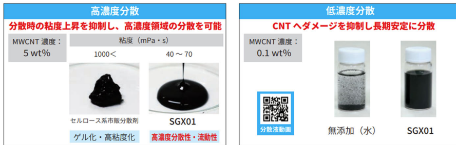
SGX®01による高濃度・低濃度分散能力